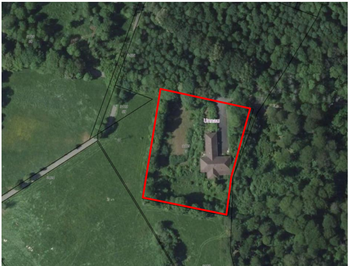
Abbildung 1: Plangebiet im Osten der Ortslage von Unnau auf Luftbildbasis (rot umrandet)

Der Planbereich umfasst das Flurstück 3189/3 in Flur 11 der Gem. Unnau mit einer Fläche von ca. 0,7407 ha laut Katasterauszug. Die Fläche laut Flächenermittlung mit CAD beträgt in Abweichung von dieser Angabe 0,7597 ha.